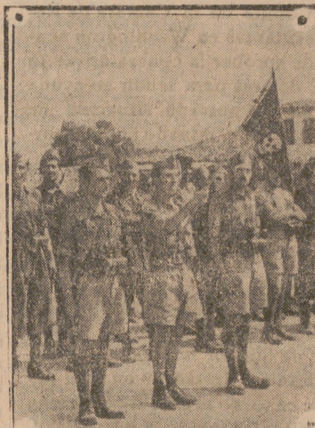
Tropas escogidas italianas fascistas, después de prestar juramento para combatir bajo la dirección alemana, reciben los simbólicos banderines de sus batallones. (Foto «Presamundo»).

Pero no por tierra, que costaría mucha sangre que el patriotismo inglés quiere aborraz. Por otro camino más rápido. Este sí fracasa es menos costoso en vidas humanas. Ya hace dos meses próximamente intentaron la destrucción de las instalaciones de petróleo de Rumania los yanquis. Todos lo recordarán. Fue un tremendo fracaso. Poco daño y muchas pérdidas sufrió el yanqui. Efecto de la enorme distancia que desde el Irak hasta Rumania tenían que recorrer (ida y vuelta) los aparatos de los Estados Unidos desde sus aeródromos situados en el Irak; pocas bombas llevaban y al encontrarse con una fortísima oposición de cazas y antiaviones germanos (los últimos modelos),