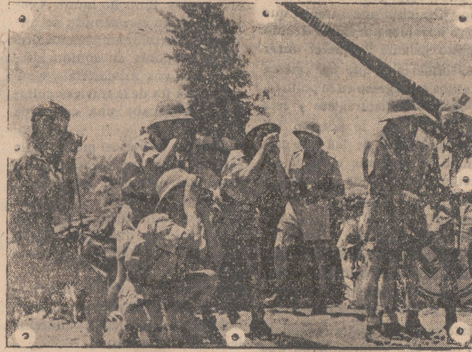
En la isla de Creta. Junto a una batería antiaérea se ve a sus servidores vigi- lando.