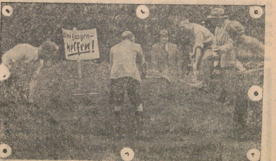
En toda Alemania ha sido organizada desde tiempo la construcción de refu- gios antiaéreos en común. En la foto los vecinos de unas casas construyen éste en el jardín de una de ellas.

La resistencia de las mil veces valero- sas tropas del Eje prosigue sin decaer un instante. A pesar de heroicidades muchas que aquellas realizan, la pro- gresión aliada continúa merced a la su- perioridad de elementos aeromaría- mos del anglosajón. Tal progresión se acusa más en el norte y trata de acen- tuarse no sólo con la colaboración de la escuadra sino con la realización de des- embarcos a la retaguardia de las tropas