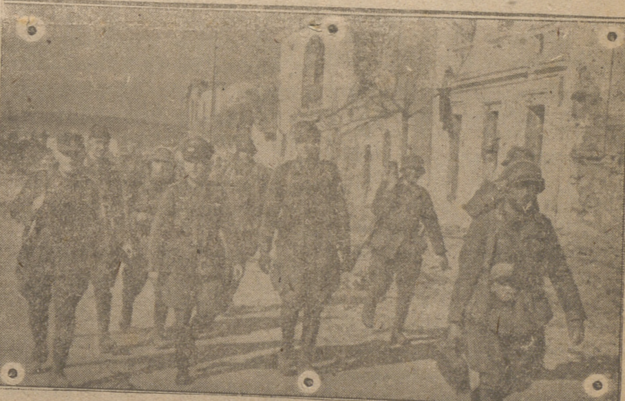
El mando de un grupo blindado alemán, entra en la ciudad de Teburba inmediatamente después de los primeros destacamentos para lograr la perfecta organización de la defensa del lugar conquistado