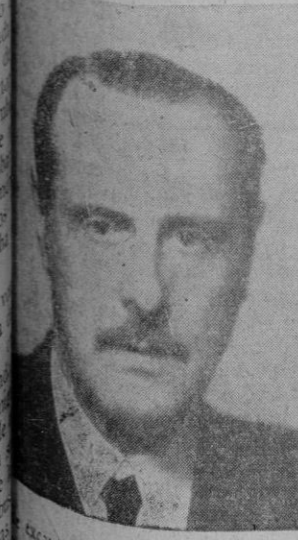
Presidente de las Cortes... fue impuesta la Medalla de Ex-captivos

Se añade que probablemente le sustituirá el general Cassin de la fracción cegaullista. También se espera la dimisión del general Berguet, miembro del Consejo de guerra del Africa francesa, el cual se espera que será reemplazado por un político francés que se encuentra ahora en Argel. EFE