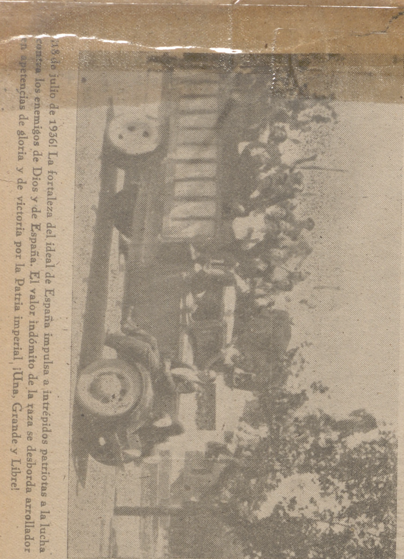
18 de julio de 1936 La fortaleza del ideal de España impulsa a intrépidos patriotas a la lucha contra los enemigos de Dios y de España. El valor indomito de la raza se desbordada arrolladora en batallas de gloria y de victoria por la Patria imperial. Una, Grande y Libre!

Sierra de cinta para entrega inmediata. Gomersindo García Serrano, 59 — MADRID