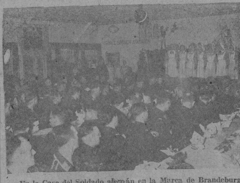
En la Casa del Soldado alemán en la Marca de Brandeburgo. Un grupo de enfermeras de la Cruz Roja cantando canciones

No olvidéis vuestra obligación de comunicar a las Delegaciones provinciales de la Caja Nacional e Subsídios Familiares de todo cambio de domicilio social, así como las variaciones de los trabajadores a vuestro cargo. — F. B.