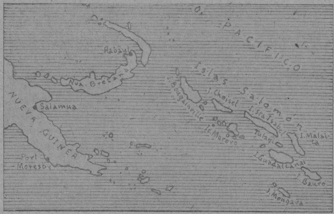
Mapa de las islas Salomón donde está entablada la lucha entre japoneses y norteamericanos.

"Será difícil--- dice Knox--- expulsar a los japoneses de Guadalcanal"