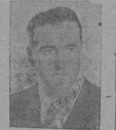
Don Alberto Martín Artajo

Dicha reunión estará presidida por el Secretario General