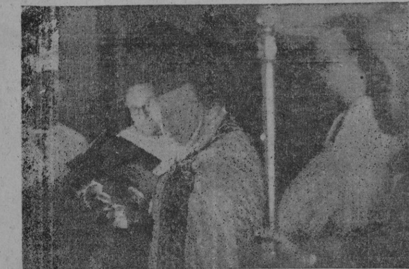
ido erigido en el local social de la Acción Católica.