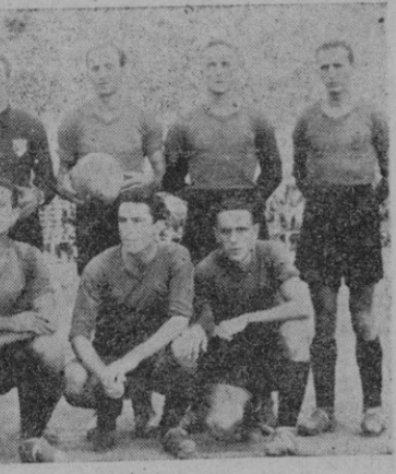
El equipo del "Mallorca" que, gracias a su victoria de ayer, queda solo en el primer lugar de la clasificación.