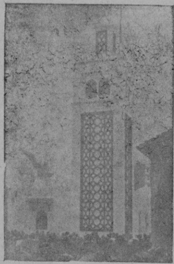
Un aspecto del exterior del pabellón marroquí de la Feria Internacional de Muestras de Barcelona, que es uno de los más visitados

Paris. — Los diarios de esta mañana publican una disposición del Jefe de policía y del Mando militar en la que se anuncia medidas de represalia y seguridad contra los atentados comunistas y terroristas. En la orden se hace saber que en represalia por la muerte de soldados alemanes, 116 terroristas y comunistas, cuya participación o complicidad en aquellos crímenes ha sido demostrada, fueron fusilados. Gran número de estos elementos han sido también deportados. Para prevenir toda clase de incidentes que pudieran originarse el 20 de septiembre con motivo de una manifestación organizada por los comunistas, todos los teatros, cines y demás espectáculos públicos serán cerrados desde esta tarde hasta la noche del domingo en los departamentos del Sena, Oise y del Marne. Nadie de la población civil, a excepción de los alemanes, podrá transitar por las calles y plaza