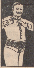
FALJA DE CABALLERO