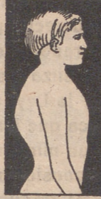
MAL DE POTT