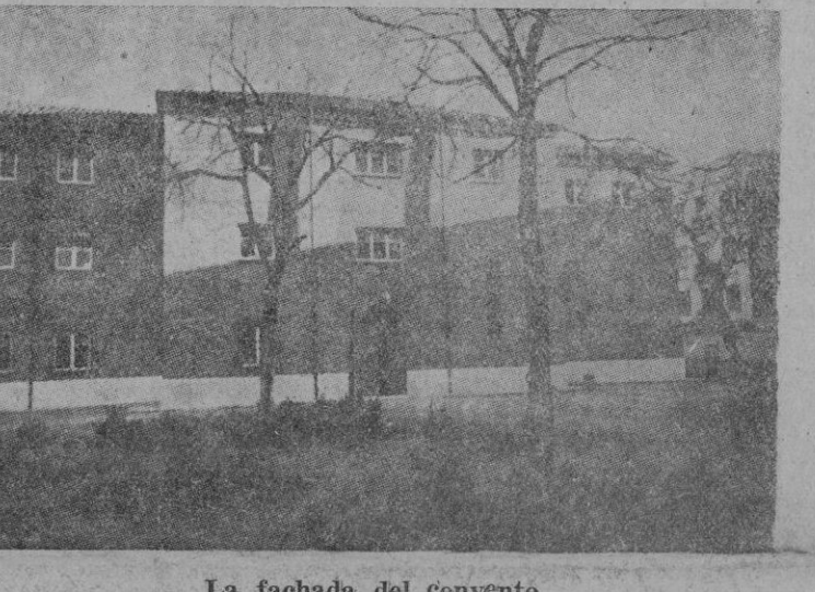
La fachada del convento