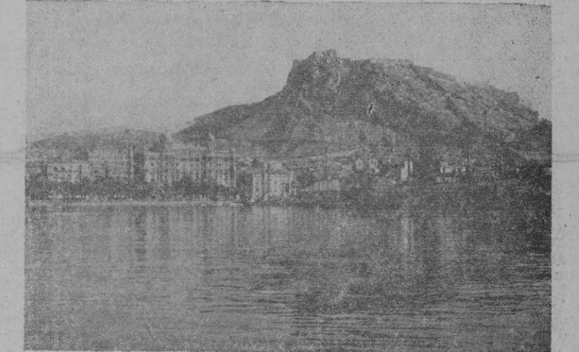
La bahía de Alicante: en primer término, la ciudad, al fondo, sobre conjunto, el Castillo de Santa Bárbara, donde — hace hoy precisamente cinco años — fué fusilado el glorioso fundador de la Falange

No ha comenzado todavía a declinar el sol cuando la tierra sobre la que cayó José Antonio se ha llenado de luz y sombra. Y es en esta hora cuando el patio donde él cayó adquiere relieve más trágico. En presencia de la cruz, de los ventanales de las celdas, de la maralla orlada por esas nubes que hacen adivinar el mar latino, más de uno habrá sentido la angustia de oír el llamamiento al sacrificio de su egoísmo. "Yo fui también de los que aspiraron a vivir en su celda", decía José Antonio, en 1935, en