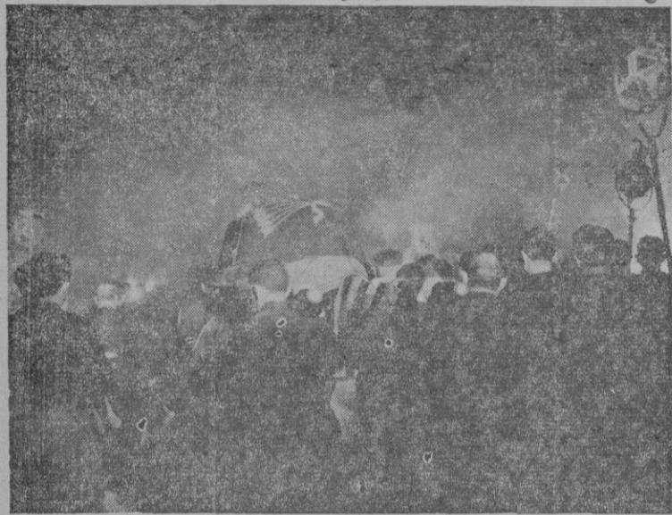
Impresionante caminar del cortejo fúnebre de José Antonio iluminada por las lumbreras de las hogueras y los hachones