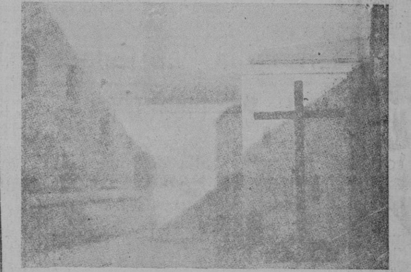
Una sencilla Cruz señala el lugar — en la cárcel alicantina, hoy "Casa de José Antonio" — donde cayó el Fundador de la Falange

... número 1 de "Haz". Hay muchos ahora que no quieren gozar de ese privilegio, que huyen de que les sea concedido. Son los cobardes, los hipócritas y los resignados. Los que tienen siempre una cuenta que presentar a la Patria, los adoradores del ídolo empalagoso de la tranquilidad, los que ya han sufrido bastante: esos se sienten más cobardes que nunca frente a la cruz del martirio. Los del pretendido idealismo, que no vacilan en disfrazar la palabra "pro-