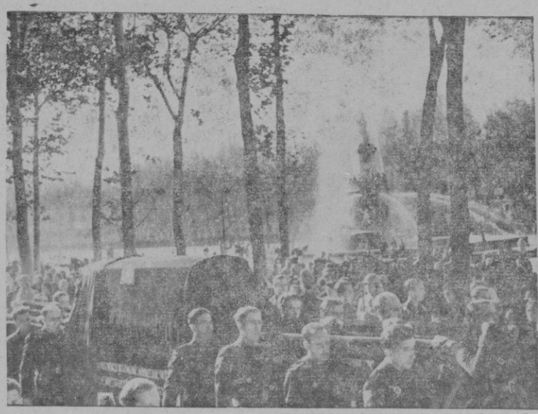
El cortejo fúnebre al salir de Aranjuez, camino de Madrid