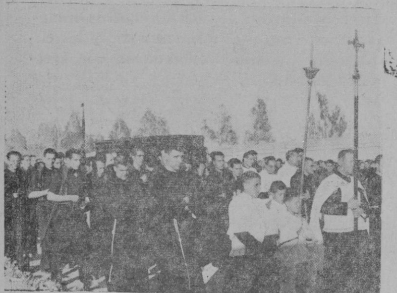
A hombros de los que fueron sus camaradas, los despojos de José Antonio van hacia Madrid