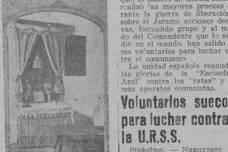
La celda en que murió Sta. Catalina Thomás; a la derecha se ven las tablas y banquetas que formaban su lecho

Aquí sí que no hay rincón que no recuerde la vida ejemplar de nuestra Santa, sus luchas, sus triunfos: la celda en que pasó toda su vida de religiosa y entregó su alma a Dios; la escalera por donde algunas veces derrocó el espíritu del mal; el albigue en que también le echó el demonio y a punto estuvo ella de perecer ahogada; el coro, escenario de no pocos de sus éxtasis y arrobos; el llamado "choret de la Beata", que es una tribuna sobre el altar mayor y en donde tanto tiempo solía ella pasar de hinojos y en oración, que quedó grabada en la arenisca la huella de sus rodillas.