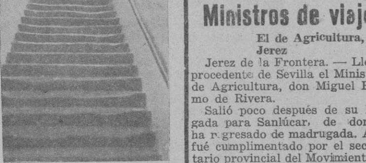
La escalera del convento de Sta. Magdalena por donde el maligno espíritu arrojó algunas veces a la Santa

En la carretera de Valldemosa y a unos 6 kms. de Palma hay a su vez la alquería llamada Son Ripoll; aquí también estuvo cierto día, la santa, niña aún, pues tenían en arriendo la finca unos parientes de los Gallart, y todavía ahora se guarda con veneración el acebuchito junto a cuyo tronco arrodillóse ella y quedó sumida en éxtasis divino.