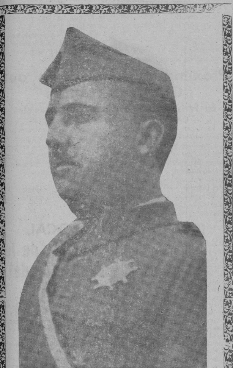
Francisco Franco, el gran Capitán de la Cruzada.

El artífice de la victoria y de la paz. Guió a los Ejércitos de su pueblo que, en los campos de batalla, recobró el sentido religioso, heroico y militar de la vida.