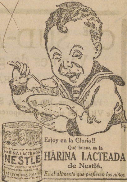
Estoy en la Gloria!! Qué buena es la HARINA LACTEADA de Nestlé. Es el alimento que prefieren los niños.

Los oficiales y clases de la nueva organización, serán indígenas.