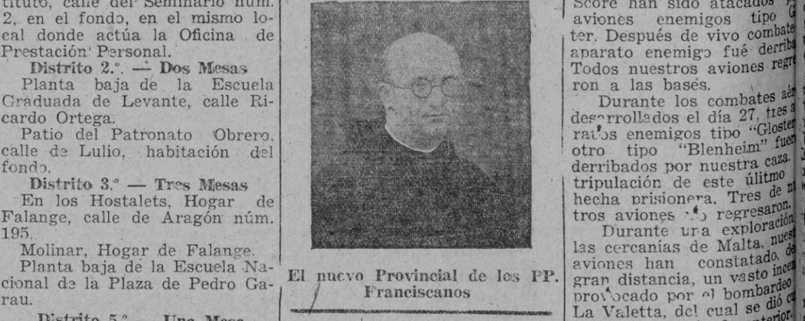
El nuevo Provincial de los PP. Franciscanos