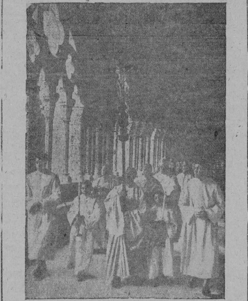
Con la sobriedad del rito cisterciense, la Cruz en alto, los monjes, seguidos de las autoridades, discurren en procesión por el claustro magnífico, camino de la iglesia, recuperada al culto, donde se entonó solemne Te-Deum.

A continuación, también profesionalmente, se dirigió la comitiva a la antigua residencia del Maestro de Novicios, hoy habilitada para Patronato. Seguidamente leyó el acta notarial en virtud de la que se cede a los monjes buena parte del edificio. Firmaron como testigos el director general de Bellas Artes, marqués de Lozoya; los gobernadores civil y militar de Tarragona; el párroco de Espulgues de Francolí, en representación del vicario general; el delegado de Hacienda de la provincia; el abad presidente general de la Orden; el alcalde de Vimbóli, y el comisario de la Zona del Patrimonio Artístico, señor Monreal.