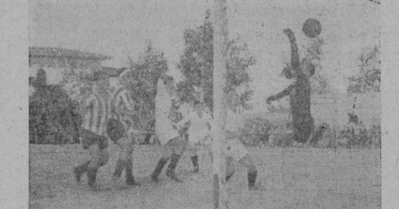
Así logró el "Gimnástica" su primer tanto, en "Sa Punta": el balón, impulsado por la cabeza de Cuevas (que aparece con el brazo levantado), no pudo ser alcanzado, pese a su esfuerzo, por Pericas.

A la expectativa, los "athleticos" Gil y Amengual y los felangineses Berga y Mestres.