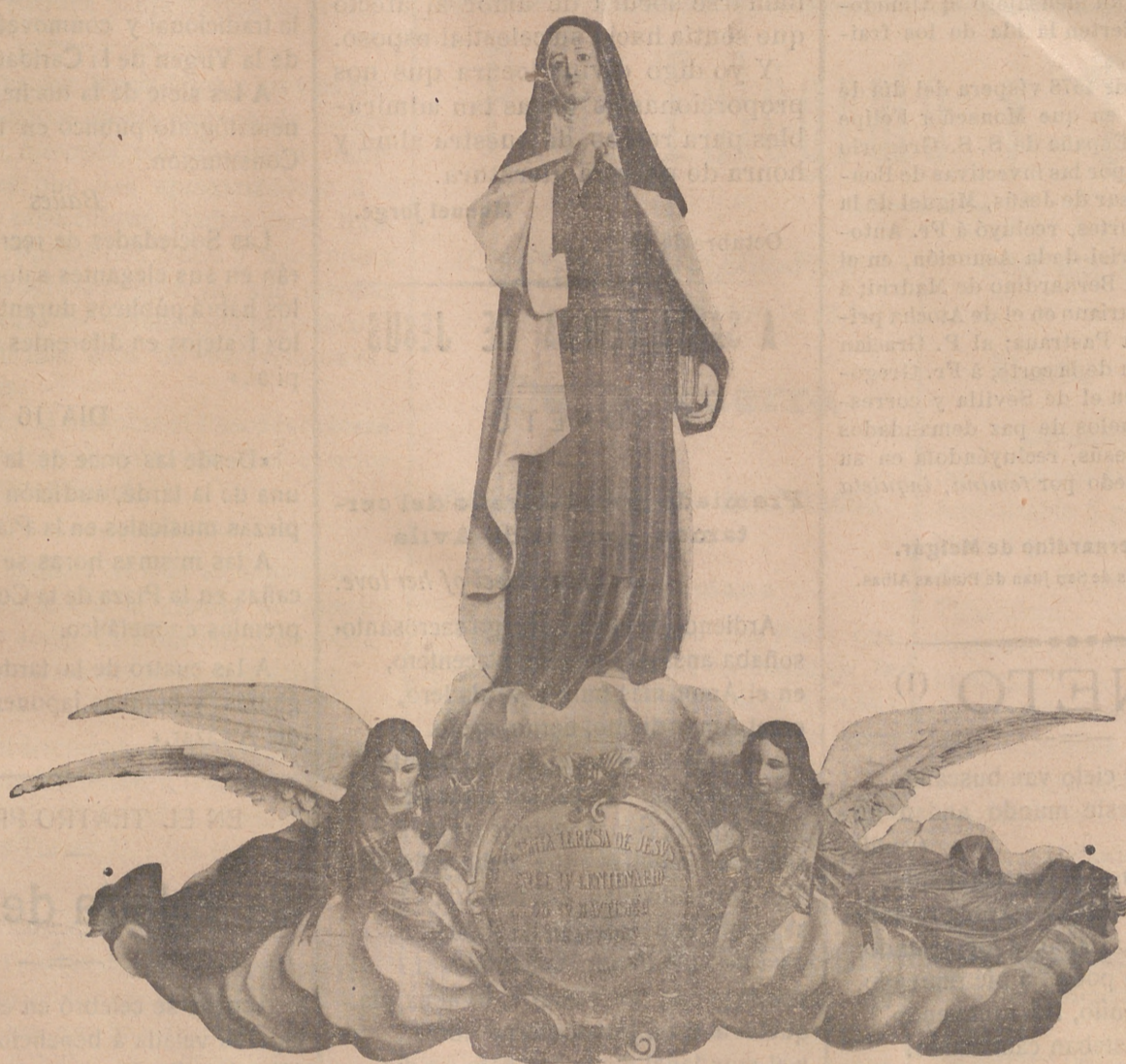
Artístico grupo, obra de los inspirados escultores Sres. Alguero é hijo, adquirido por suscripción entre los devotos de la Santa, é instalado en el recinto sagrado de la Pila Bautismal de la parroquial Iglesia de San Juan Bautista de Avila, en que nació á la vida de la santidad la Doctora Mística.