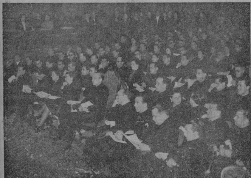
El Excmo. Sr. Ministro de la Gobernación, D. Ramón Serrano Suñer, y el de Educación Nacional, D. José Ibáñez Martín, y las Jeraquías de la Palanca durante el concierto celebrado en el Teatro Español, de Madrid, con motivo de la sesión de clausura del III Congreso Nacional de "Auxilio Social".