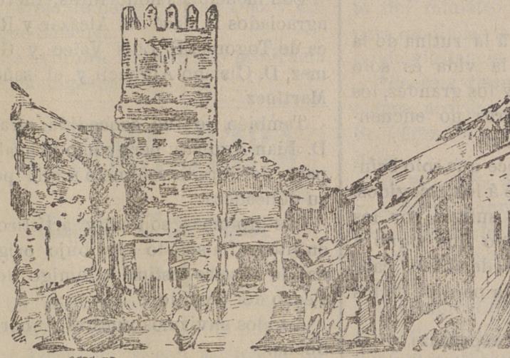
Una calle de Marrakes.

ta el presente, son los únicos que han cumplido el convenio de Algeciras, y los únicos que mantienen la poca paz que disfrutamos.