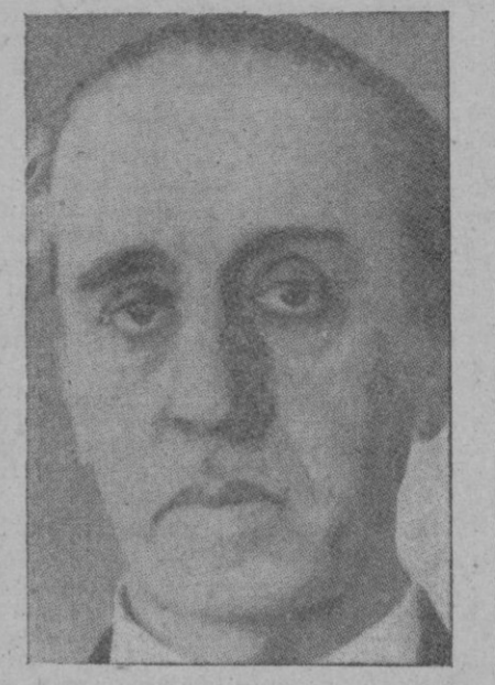
Benjumea un plan nacional para aprovechar el esfuerzo de todos los españoles.

Sevilla. — El Excmo. Sr. Ministro de Agricultura y Trabajo, don Joaquín Benjumea y Murill, inauguró ayer tarde el curso de conferencias en el “Ateneo Sevillano”.