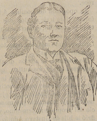
Mr. E. Shackleton, jefe de la expedición.

Todas las tentativas hasta ahora efectuadas por alcanzar el Polo Sur, han sido infructuosas y M. Shackleton segundo oficial del Discovery , que es el que ha llegado á alcanzar latitudes más elevadas, prepara otra excursión lleno de esperanzas, en la que espera alcanzar la meta ambicionada.