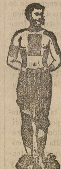
Trade Mark Registered

Curan reumatismo, resfriados, dolor de riñones, dolor de espalda, dolor de pulmones, lumbago, ciática, contusiones, etc., etc.