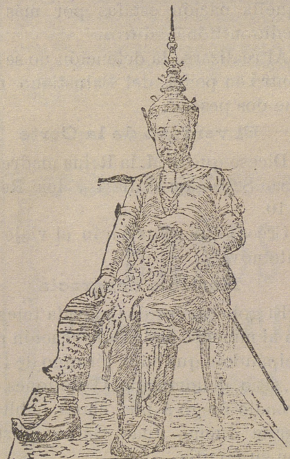
El Rey Sisowath, monarca de Camboya, que actualmente se encuentra en París.