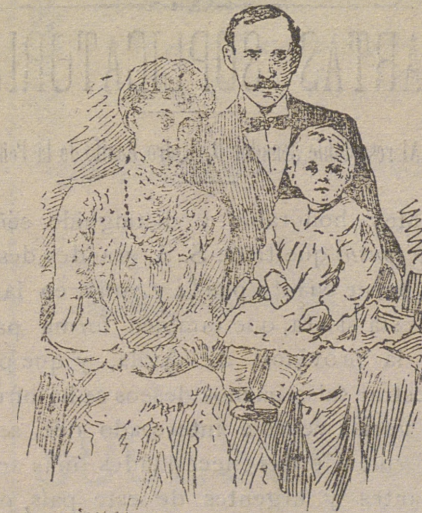
El Rey de Noruega Haakon VII recientemente coronado, su augusta esposa é hijo.