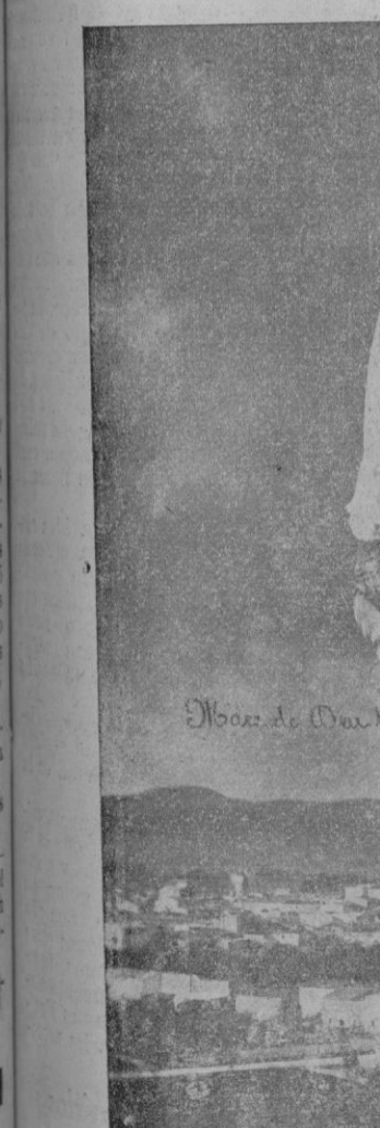
«Mare de Deu Trobada de Sant Llorenç»

San Lorenzo estaba en deuda con la Virgen Trobada. A pesar de haber sido la Virgen que más venerada estuvo durante la invasión marxista a nuestra Isla; aunque los vecinos le tributaban frecuentes oraciones de rogativa y acción de gracias durante la pasada Cruzada; no obstante no había tenido Ella las fiestas extraordinarias, que a otras figuras de la Virgen de Mallorca, mucho más veneradas del frente, habían sido dedicadas, por esperarse que los dos centenares de hijos que San Lorenzo tenía en el frente pudieran asistir a ellas.