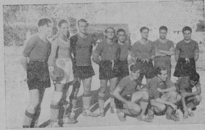
Este es el equipo del «Mallorca» que el pasado domingo reapareció, frente al «Hércules», en el campo de «Buenos Aires».

EL EX. 5 de Noviembre. Año de la Victoria.