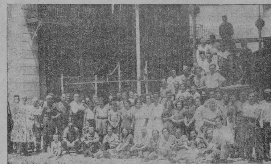
Todo el personal y obreros que trabajan en el Matadero, posan para "CORREO DE MALLORCA"