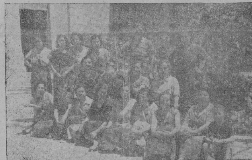
Un grupo de obreras, las de la sección de volatería