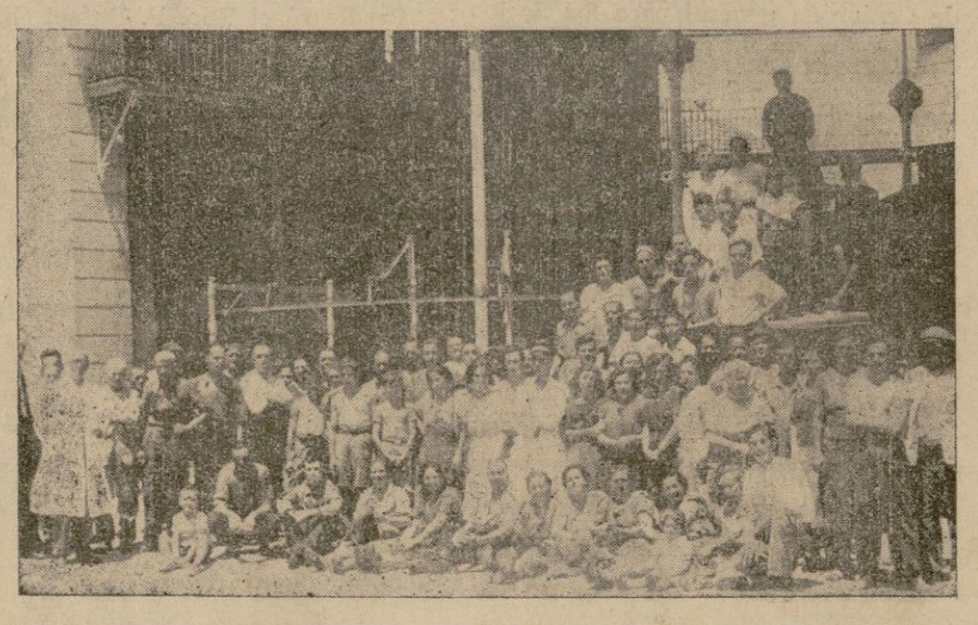
Todo el personal y obreros que trabajan en el Matadero posan para "CORREO DE MALLORCA"