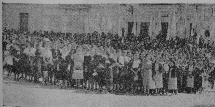
Numerosísimo grupo de jóvenes que asistieron a la Asamblea de la Juventud Femenina de Acción Católica que tuvo lugar en Manacor, esperando en la plaza del Rector Rubí, el momento de entrar en la iglesia parroquial

Como se ve, el partido promete ser de los buenos, dadas las características que lo integran, por lo que se augura una buena entrada en el terreno de "Son Canals".