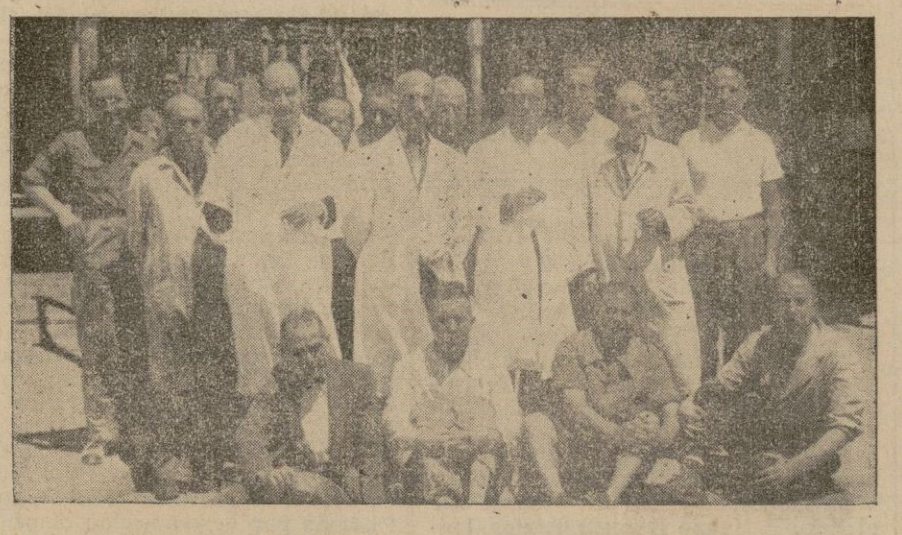
Los veterinarios, con los empleados de la Casa

Durante la campaña victoriosamente terminada, los servicios del Matadero, naturalmente, estuvieron siempre dispuestos para satisfacer cuantas atenciones reclamara la "tucha". Y así hubo días —aquellos en que nues-