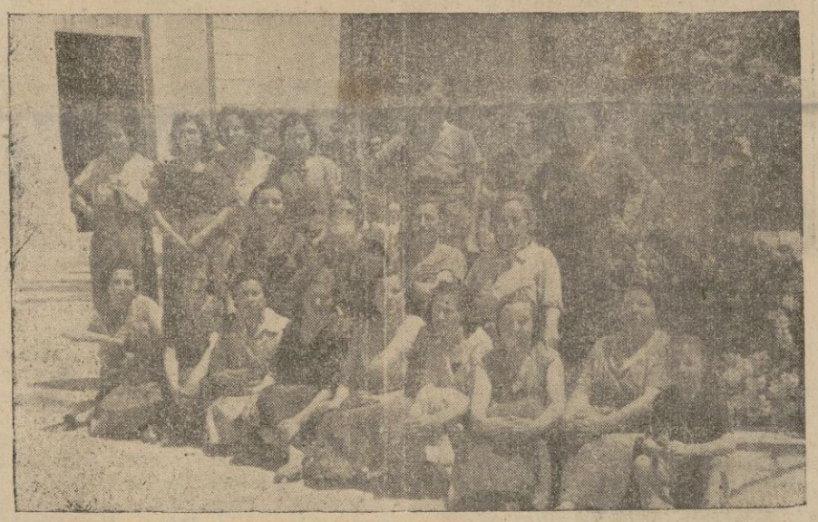
Un grupo de obreras, las de la sección de volatería