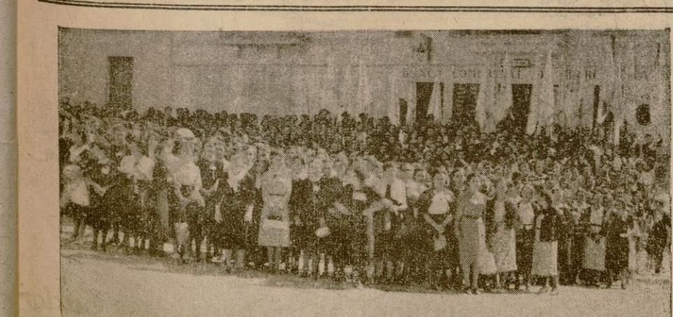
Numerosísimo grupo de jóvenes que asistieron a la Asamblea de la Juventud Femenina de Acción Católica que tuvo lugar en Manacor, esperando en la plaza del Rector Rubí, el momento de entrar en la iglesia parroquial