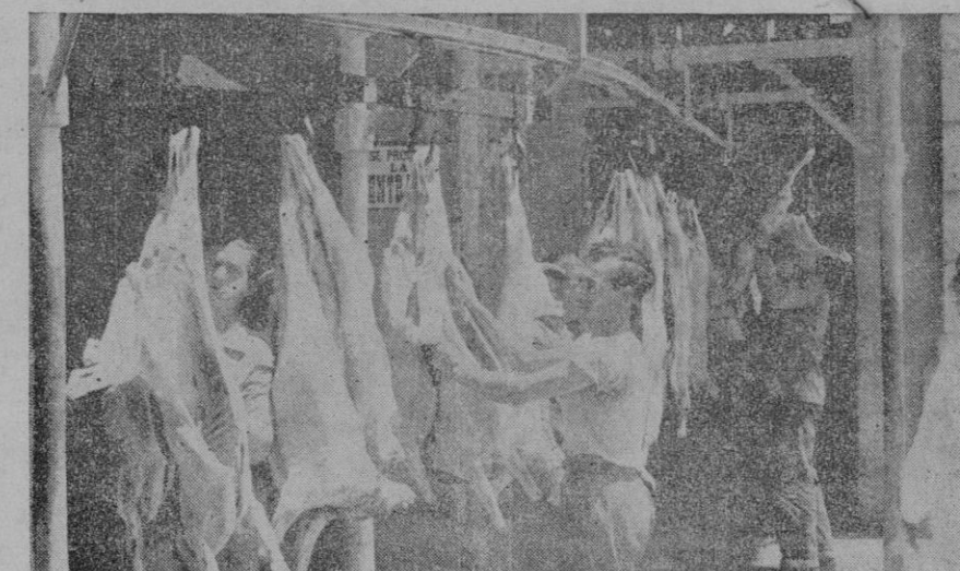
Los corderos, ya muertos, van camino de la magnífica báscula que ha de dar su peso antes de salir hacia el expendedor

carne que consumía el Ejército de Levante —muchos miles de hombres— se realizaba en nuestro Matadero. La matanza, naturalmente, se verifica de un día para otro: lo sacrificado ayer, por ejemplo, es lo que se ha expendido hoy en la plaza de abastos. El proceso, en el establecimiento,