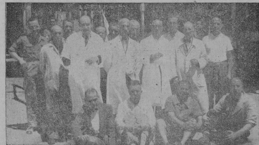
Los veterinarios, con los empleados de la Casa

Durante la campaña victoriosamente terminada, los servicios del Matadero, naturalmente, estuvieron siempre dispuestos para satisfacer cuantas atenciones reclamara la Ucha. Y así hubo días —aquellos en que nuestra Escuadra estaba en Palma— en que se sacrificaba a todas horas del día y de la noche. Y desde la liberación de Castellón, la matanza de la