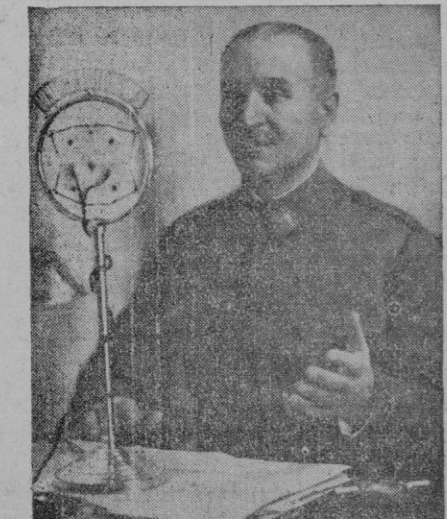
General Queipo de Llano hablando desde el micrófono de Radio Berlín.

De aquí se dirigirá a Ankara, donde permanecerá dos días. Seguidamente irá a Atenas.