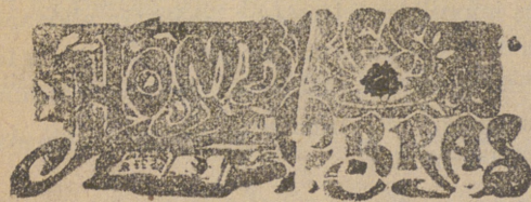
GABRIEL GARCÍA TASSARA

Como poeta y escritor político contribuyó no poco Gabriel García Tassara al engrandecimiento de las Letras patrias, y como diplomático supo sembrar fructífera semilla en el suelo americano, particularmente en las Américas latinas, hasta el extremo de dar motivo á que el gobierno de Washington se quejara de que el Sr. Tassara, en el ejercicio de su cargo, se separaba de la política de otros representantes europeos, cultivando con pre-