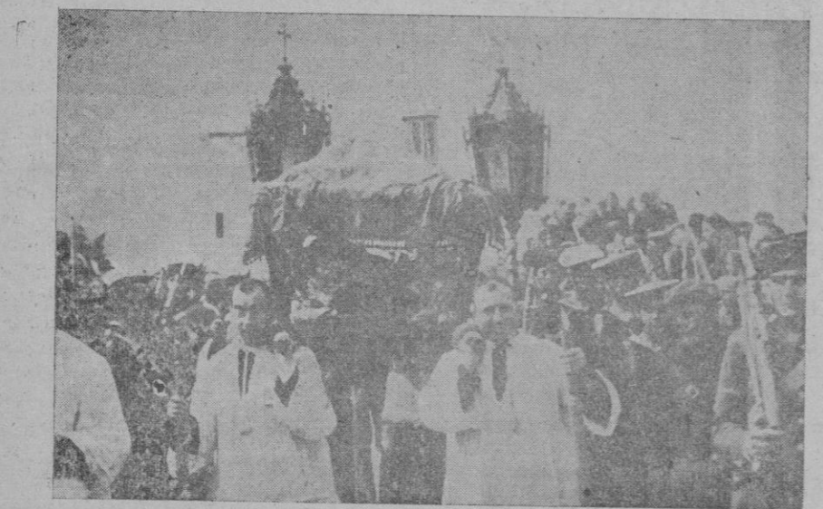
La sagrada urna, entre ingente multitud, llevada en andas por señores sacerdotes, inicia el regreso hacia Manacor, desde el Puerto

Hoy, Consejo de ministros del Gabinete italiano. — Hoy, a las once, se reunió en Consejo de ministros, en el Palacio Viminal, bajo la presidencia del Duce, el gabinete italiano.