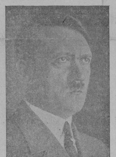
Denuncia del acuerdo naval anglo-germano

Berlín. — A mediodía de ayer el Canciller Hitler ha pronunciado ante el Reichstag de la gran Alemania el discurso esperado con la mayor expectación por el mundo entero, respondiendo al mensaje del presidente Roosevelt.