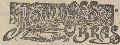
EL DOCTOR HYSERN

Y el Estado puede y debe realizar esa aspiración.