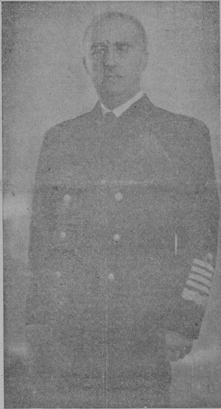
¡FRANCO, FRANCO, FRANCO!