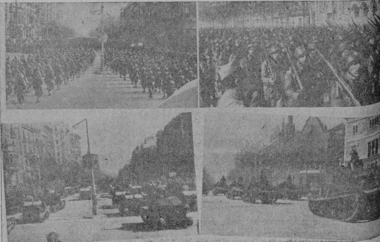
... y desfilan también los batallones de Infantería, la Legión, baterías, tanques... Todo lo que integra el magnífico Ejército de España, creado por Franco, reveló su organización, su pujanza, mientras volaban escuadrillas y más escuadrillas.

Reina gran entusiasmo para asistir a la brillante fiesta militar.