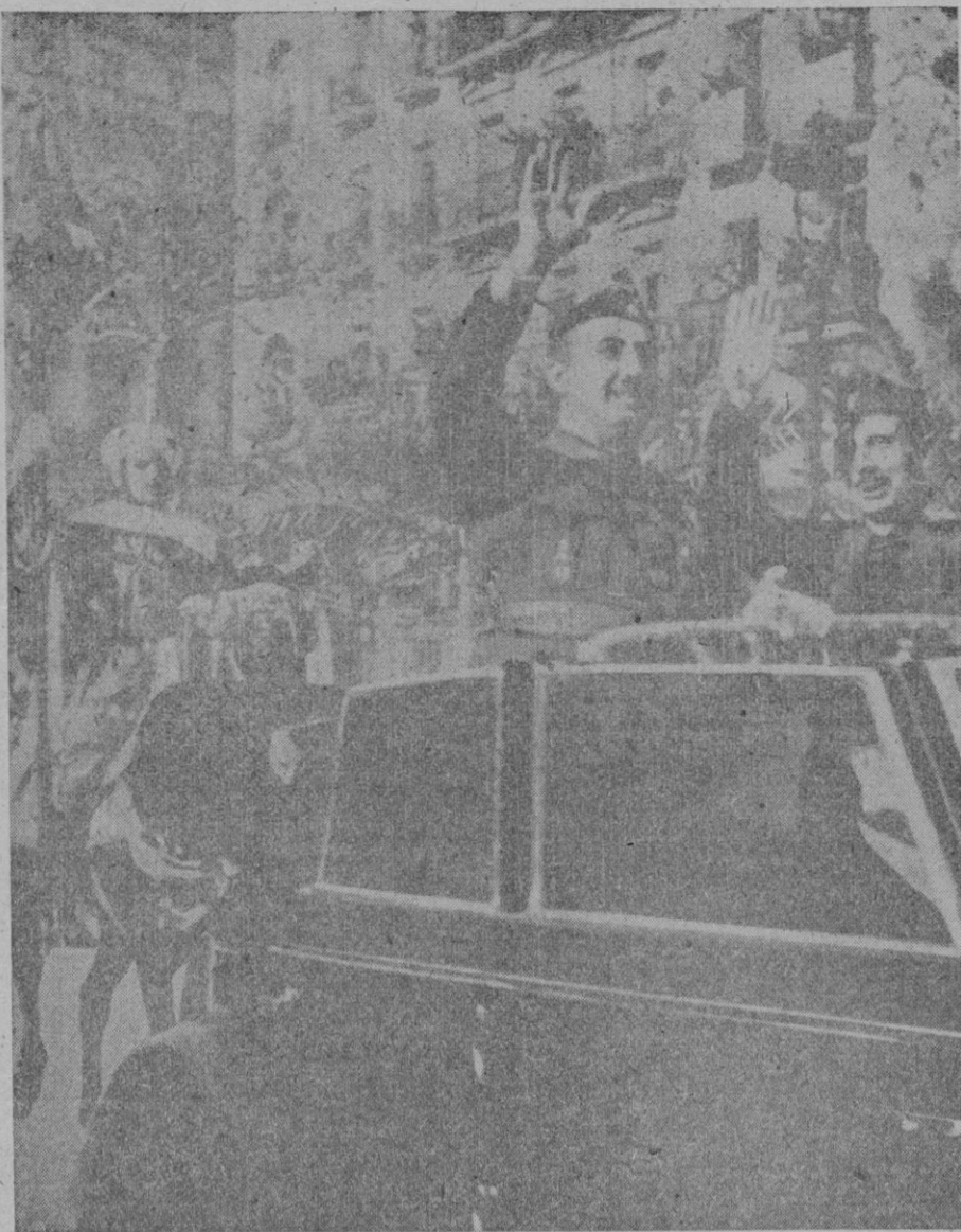
Brazo en alto, el Caudillo de España, el Victorioso, el Liberador, revista las divisiones españolas en la Avenida de Pedralbes. A su lado, el ilustre General-Jefe del Ejército del Norte y Ministro de la Guerra, Excmo. señor Don Fidel Dávila