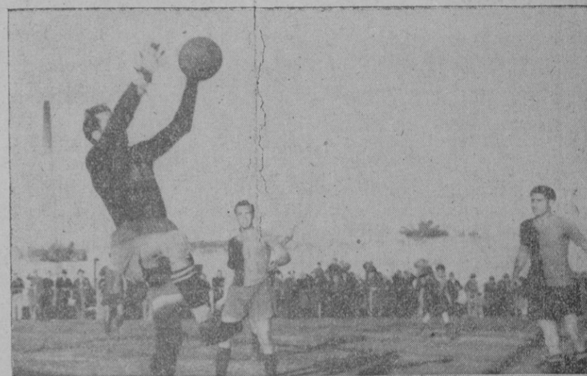
El portero del «Soledad» blocando un tiro de Antolin