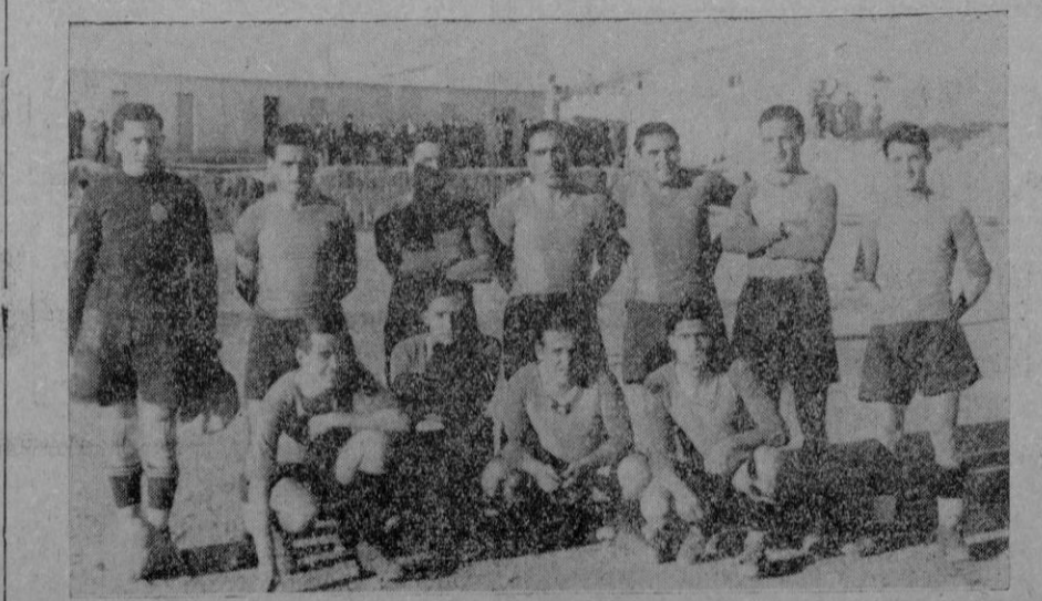
Equipo del "Poblense", que venció anteayer al "Hércules" por 3 goals a 1

Praga. — El Gobierno checoslovaco está celebrando periódicamente reuniones con el fin de preparar la apertura de la Cámara que se prevé para el día 13 de los corrientes.