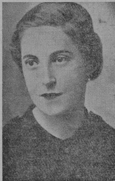
Pilar Primo de Rivera

La jefe nacional depositó, ante la Cruz de los Caídos, ramos de flores, cantándose los himnos nacionales.