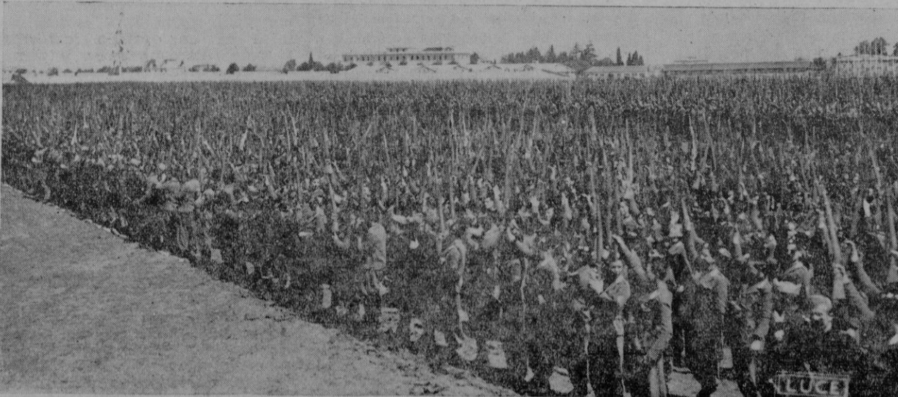
Roma. — Un aspecto del aeródromo de Centocelle, donde tuvo lugar la gran concentración de 52.000 vanguardistas, durante los brillantes ejercicios. (Fotografía llegada en avión)

gión, a quienes saludó el Führer con el brazo en alto.