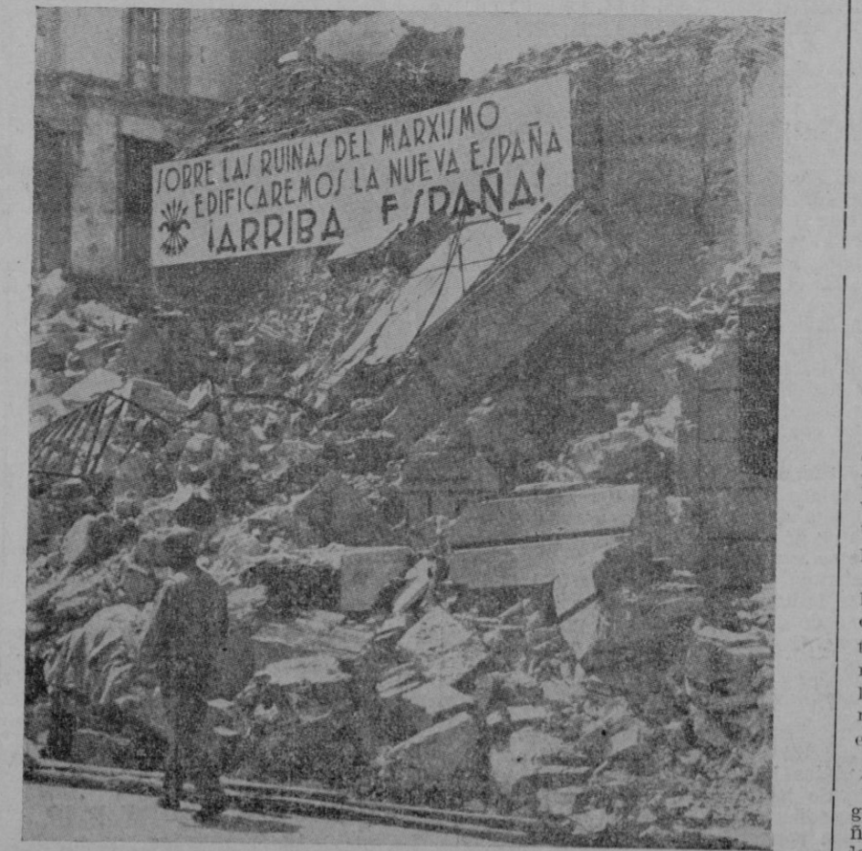
En una vía de Gandesa, ciudad conquistada por las valientes tropas nacionales: cartel colocado sobre las ruinas de una casa hecha saltar con la dinamita por los rojos antes de ser éstos puestos en fuga

Vicente Barrera toreó colosalmente toda la tarde. Se lució en quites, y con la muleta hizo faenas escalofriantes, que levantaron al público de sus asientos. Del primero se des-