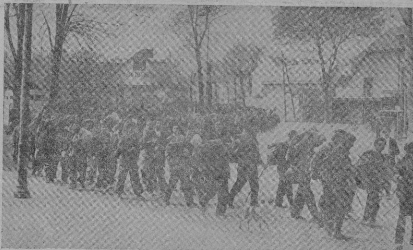
Otra vez los milicianos marxistas, restos del ejército rojo en derrota en el Valle de Arán, han irrumpido en Luchon, perturbando la tranquilidad en la pequeña villa pirenaica francesa. Esa larga columna de fugitivos que acaba de atravesar la frontera, se dirige a la Casa Consistorial, para ser identificados