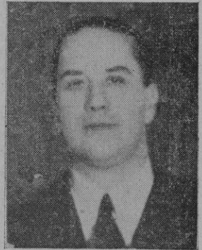
El Conde Ciano

No se sabe aún con certeza si el protocolo conteniendo los acuerdos conseguidos en las negociaciones se firmará en Roma o en Londres. Si se firmara en la capital británica, iría allá, como plenipotenciario, el Ministro de Negocios Extranjeros de Italia, Conde Ciano.