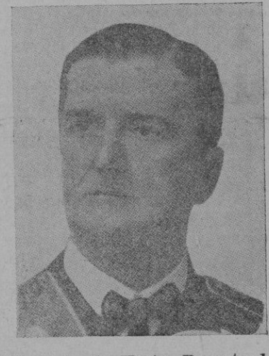
El almirante Horthy, Regente de Hungría

Budapest. — El Regente de Hungría, almirante Horthy, se dirigió, por radio, al país, pronunciando un discurso en el que dijo que todo el pueblo húngaro debía estar unido alrededor del Gabinete, que goza por entero de la absoluta confianza del Jefe del Estado para completar sus tareas, especialmente para realizar el plan quinquenal. Habló de la reconstrucción de la vida económica y social del país, y dijo que ello era en vistas de aumentar la potencia militar. Refiriéndose a la unión de Austria con Alemania, dijo que, para los húngaros, esto no era nada extraño, ya que Austria era un Estado ficticio, elaborado por un tratado descabellado.