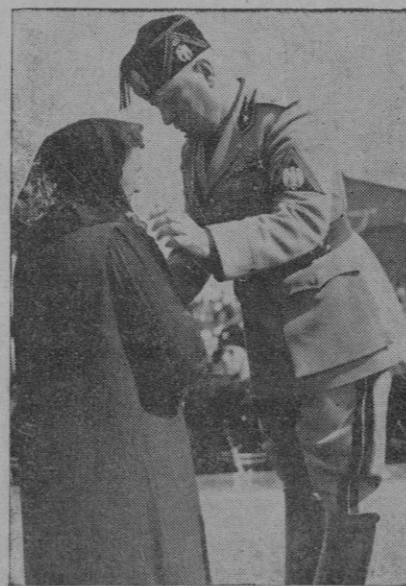
Roma. — El Duce condecora a la madre de un heroico aviador muerto, con motivo del XV aniversario de la Aeronáutica

Todas las personalidades y pueblo que asistió a la reunión salieron altamente satisfechos de la misma.