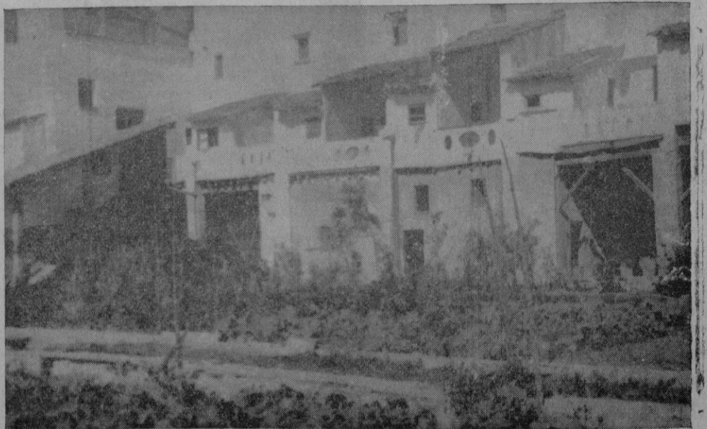
Típicas celdas del ala norte

Y si vemos cuánto dejó forjado el gótico estilo, por los años de 1460 en que se alzó el templo para servir de mansión al Altísimo, cuán sencilla y opuesta simplicidad se alcanza, al recorrer las celdas, blanquitas, limpias, abiertas a lo largo del gran corredor del cuerpo Norte. Todas ellas con su típica y característica disposición propia de la regla de la Orden Jerónima, van mostrando su avanzado terradillo hacia el tranquilo huerto, todo luz, pero también todo pobreza y rígida