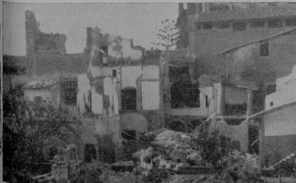
Aspecto general de la parte destruida