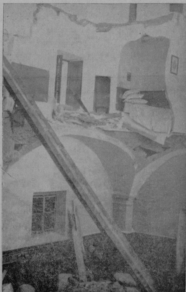
Ruinas de la Sala Capitular y dependencias superiores

recho del edificio. En cambio en un orden artístico diverso es de lamentar la rotura de la valiosa tabla flameada del cuatrocientos que con su guarda-pulvo presidia los actos capitulares de las Religiosas.