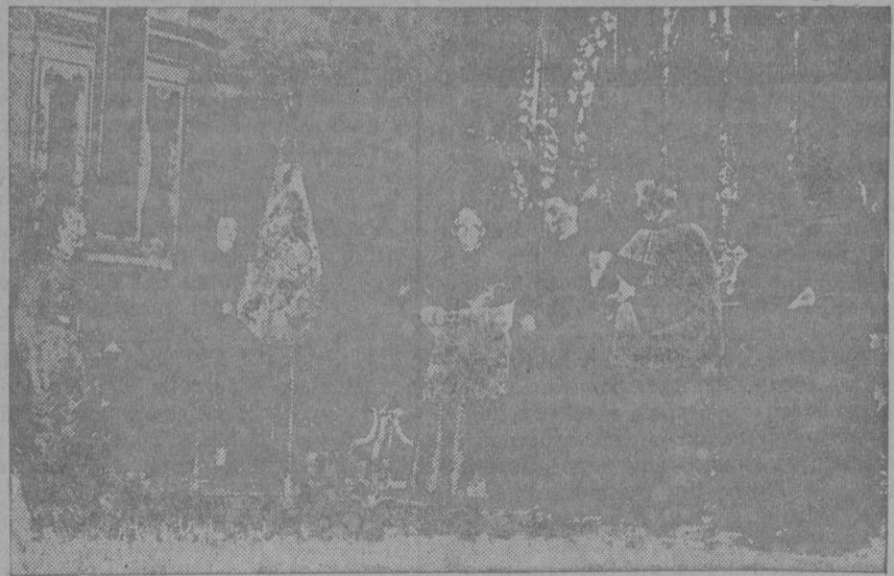
El altar mayor de la iglesia de San Francisco durante la bendición de la bandera de los Requetés.