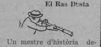
Un mestre d'història de