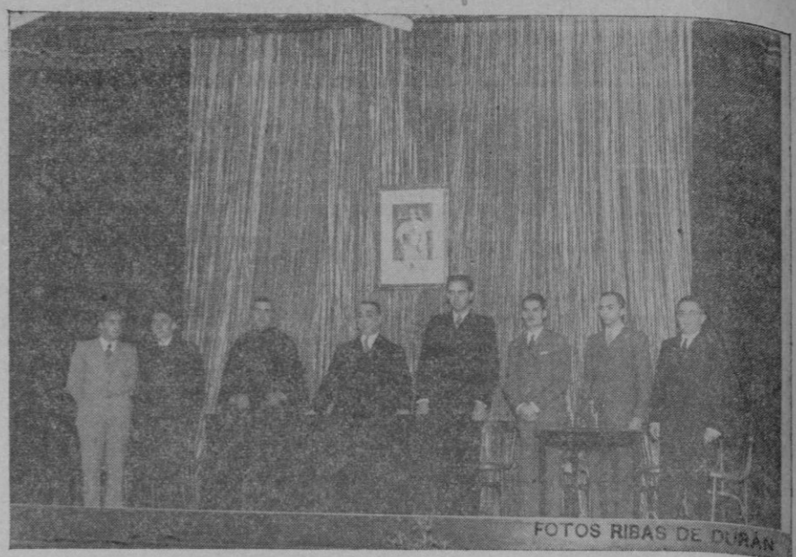
La presidencia del acto de clausura, celebrado en el "Salón Rialto"

"Qué piensa y qué juzga..." Ordinariamente, se dice que el hombre es un animal racional; si se le quita el razonar, se queda, por tanto, en animal. Y, sin embargo, la inmensa mayoría de las veces, la gente no razona, sino que cree hacerlo, cuando en realidad no hace más que justificar sus pasiones. Para razonar hay que estar completamente desapasionados, y sólo así se podrán tomar las decisiones más convenientes. Las ideas