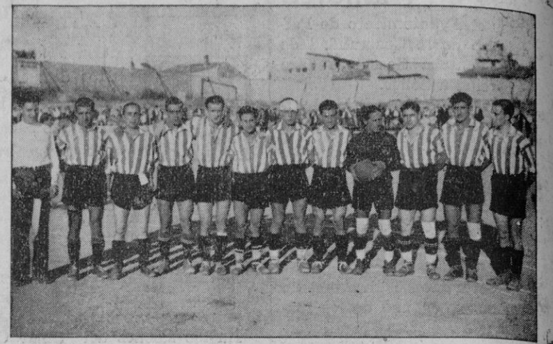
El notable once del "Centre Esports Manresa", que el domingo y los próximos jugará dos interesantes encuentros contra nuestro "Balears F. C." en el campo de Son Canals.