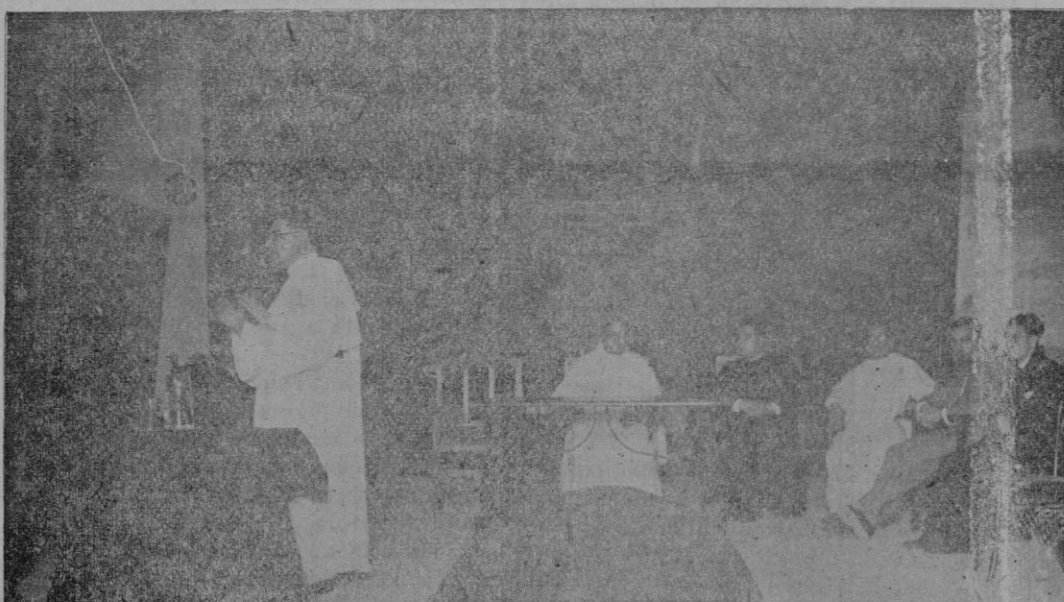
I. Magnífico arco de luz colocado en la iglesia de los PP. Dominicos de la ciudad de Manacor en las fiestas centenarias de la Canonización de Santo Domingo, obra del artista don Bartolomé Riera. II. El P. Gafo pronunciando ante el micrófono instalado por el ingeniero don Luis Ferrer una de sus magníficas conferencias en el Teatro Centro de Variedades de aquella Ciudad.