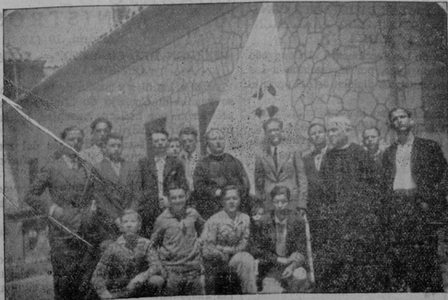
Junta Directiva de la Juventud Católica Masculina de Selva

La Secretaría estará abierta todos los días laborables de 11 a 1.