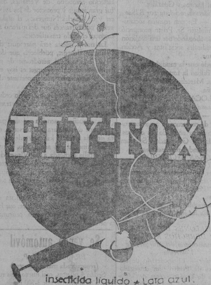
Insecticida líquido * Lata azul.

La Última Hora Despacho: P. Sta. Eulalia núm. 10