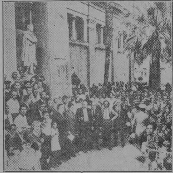
Villanueva y Geltrú.—(1) Momentos de descubrir la lápida que da el nombre de Manuel Cabanyes a una de las principales calles, con motivo del primer centenario de su muerte. (2) La manifestación delante de la estatua del poeta Manuel Cabanyes.

quitar, operación difícilísima (véase "La Nación" 18 de Oct. 1926).