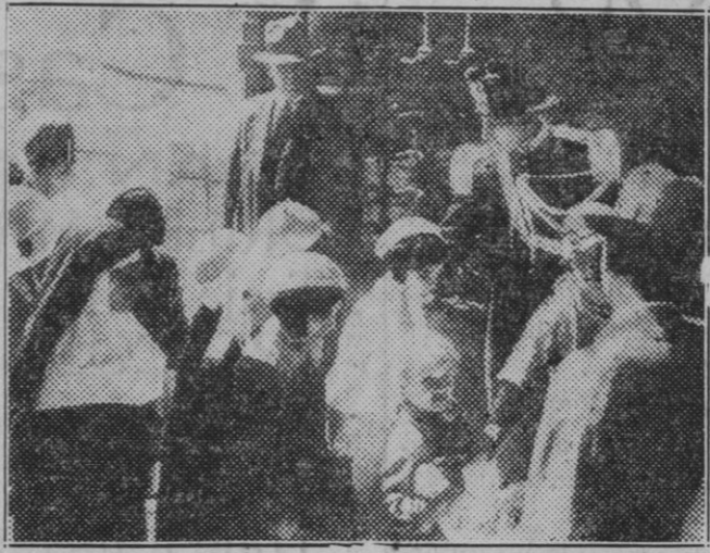
Ciudad del Vaticano. — Con motivo de la explosión de una bomba en el pórtico de la Basílica de San Pedro, la guardia y agentes secretos requisan las paqueterías que llevan los visitantes.

Se pone en conocimiento de los Sres. Accionistas que el día 11 del corriente se abrirá el pago en estas Oficinas, del dividendo activo a cuenta de los beneficios del ejercicio del año 1933.