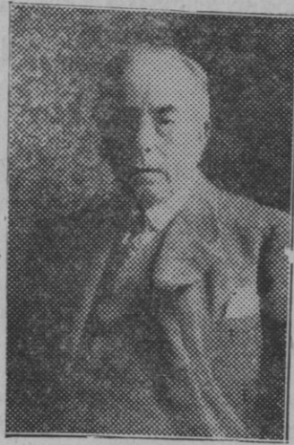
Barcelona. — El ilustre escultor Eusebio Arnau Mascort que ha fallecido repentinamente.

Antes de partir las ocho escuadrillas que componen el conjunto de la expedición oyeron misa de campaña en el cementerio donde yace a los aviadores que sucumbieron en la conquista del elemento gaseoso, como homenaje a los bravos que han ofrecido sus vidas