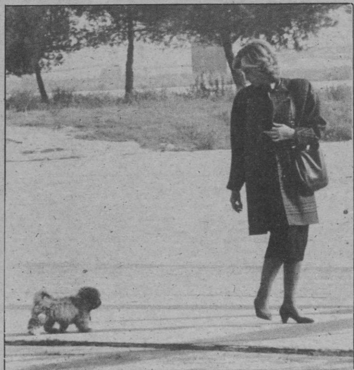
La Reina Doña Sofía, fotografiada a su llegada al aeropuerto de Madrid-Barajas, procedente de Nueva York, mientras dirige su mirada a un perrito que ha traído de su viaje a Estados Unidos.

conversar en varias ocasiones, con motivo de las «cumbres» comunitarias de jefes de Gobierno, ésta será la primera vez que ambos mantengan un contacto oficial, tras el ingreso de España en la Comunidad Económica Europea.