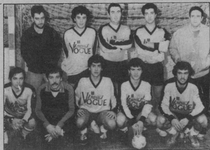
Vogue Riomar, primer triunfo