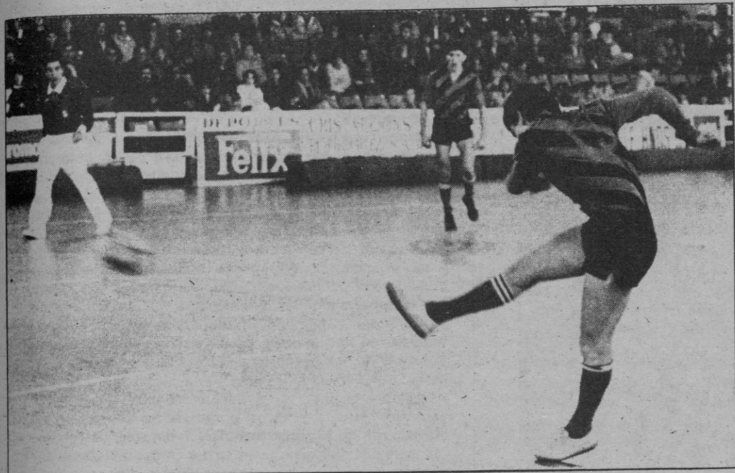
Estilo sí hay