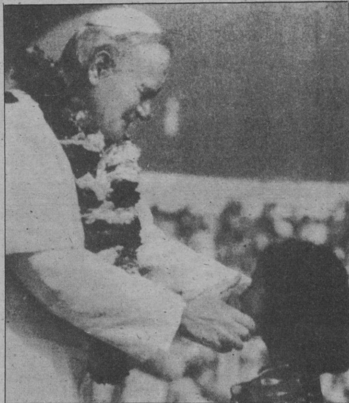
Su Santidad el Papa, que realiza un largo viaje pastoral por Oriente y Australia, abandonó ayer Bangladesh, hizo una escala en Singapur y llegó por la tarde a las islas Fidji. En la imagen, Juan Pablo II bendice a una niña al abandonar Dacca.

El Papa acabó su tercer día de viaje con un encuentro con los obispos de la Conferencia Episcopal del Pacífico, que tiene aquí su sede.—Efe.