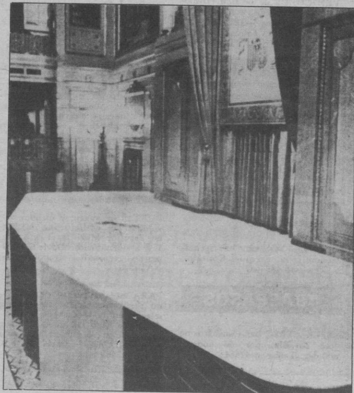
La tribuna del hemiciclo del Congreso de los Diputados ha sido cubierta con un gran estrado, dentro de los preparativos que se realizan en el palacio de la Carrera de San Jerónimo para la solemne ceremonia que se celebrará el día 30, en la que el Príncipe de Asturias prestará juramento a la Constitución

El número de casos se duplica cada ocho meses en este país, y no se descarta que en los próximos años fallezcan 10.000 alemanes como consecuencia del virus del «SIDA».- Efe.