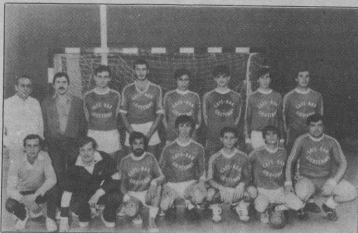
Lieutenant; uno de los mejores

Chuletín, 1 (Saez) Lieutenant, 7 (Rubén, Jesús 2, y Delgado 4)