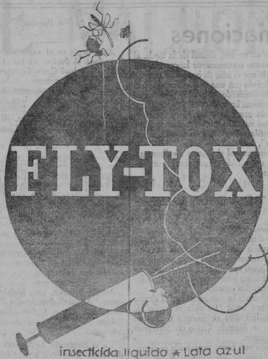
insecticida liquido * Lata azul